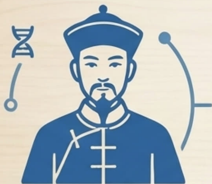
[Mężczyzna z Fujian]